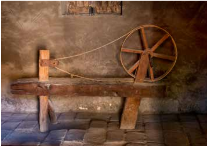
Rueca primitiva en exposición

La segunda misión de Santa Cruz experimentó diversos desafíos, lo cual le otorgó el apodo de “La Misión de la Mala Suerte”. Las enfermedades arrasaron con el pueblo neófito de la misión y muchos