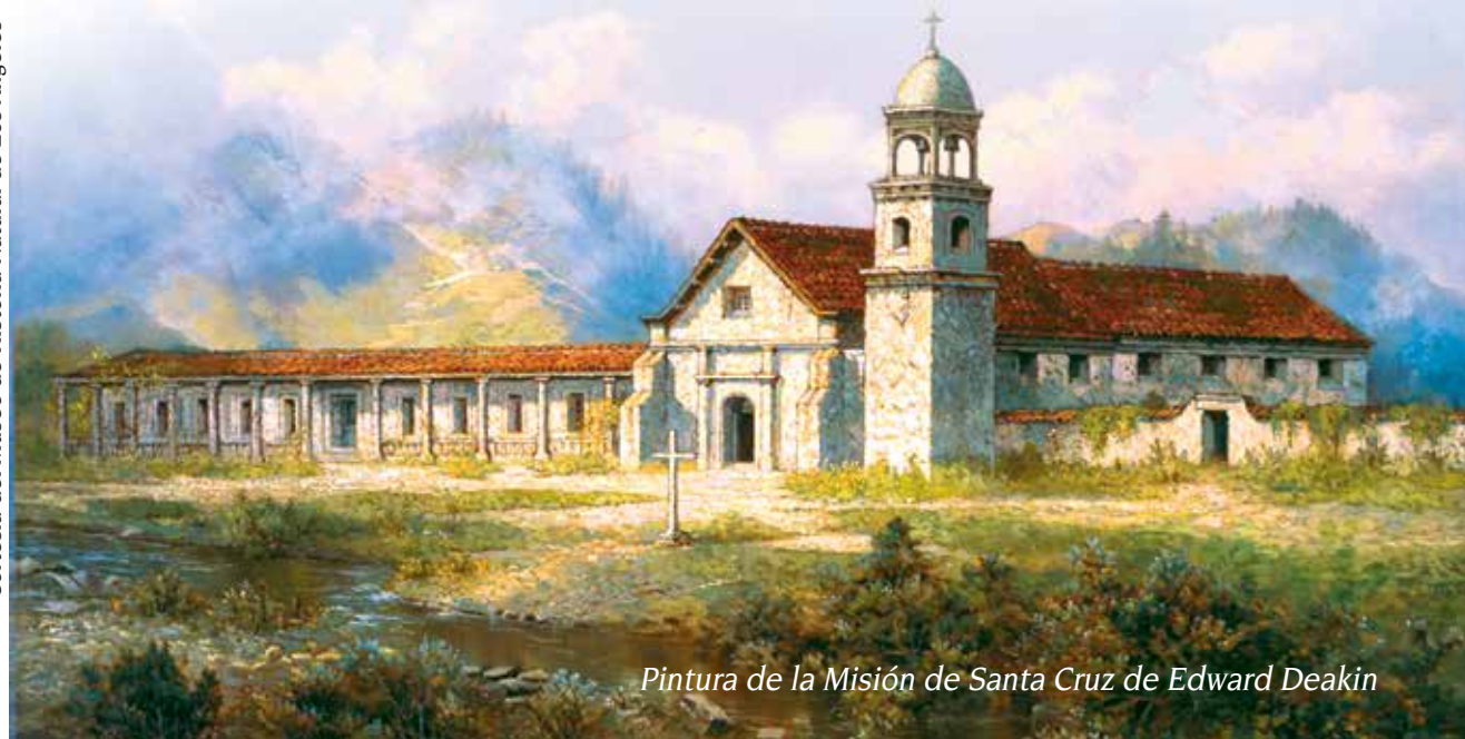
Pintura de la Misión de Santa Cruz de Edward Deakin