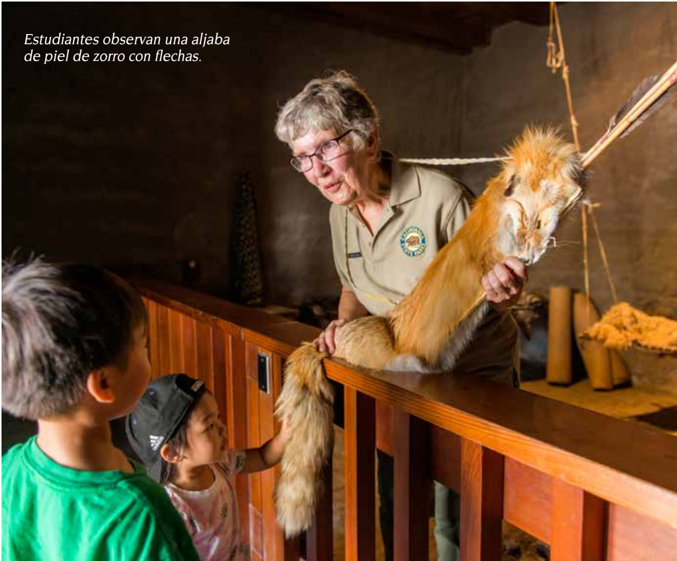
Estudiantes observan una aljaba de piel de zorro con flechas.