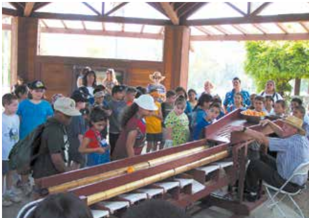
Paseo guiado en el medidor de naranjas

La zona de picnic para grupos simboliza el aspecto y el ambiente del periodo anterior a la Segunda Guerra Mundial: tranquilo, natural y propicio para un picnic familiar y pasear bajo los árboles. Un anfiteatro exterior y una glorieta para interpretaciones proporcionan un fondo para presentaciones al aire libre y eventos especiales. Consulte www.parks.ca.gov/calcitrus para conocer más detalles.