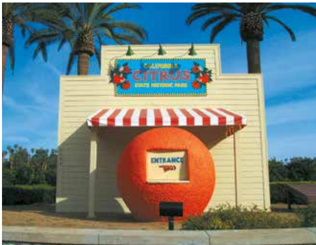
Replica de puesto de naranja antiguo

De todos los cultivos que componen el legado agrícola de California, las naranjas jugosas y doradas evocaban una imagen de romance, prosperidad y abundancia. Veranos cálidos y secos e inviernos frescos y húmedos ofrecen las condiciones perfectas para el cultivo. Entre finales del siglo XIX y comienzos del siglo XX, los huertos se extendían a través de los condados de Riverside, San Bernardino, Orange, Los Ángeles y Ventura, y hacia el Valle Central. Esta segunda “fiebre del oro” de California,