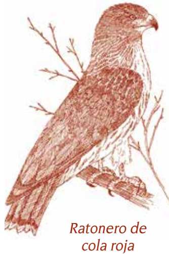
Ratonero de cola roja

El terreno es algo montañoso, con elevaciones que van de 920 a 1,060 pies sobre el nivel del mar. El arroyo del Cañón Mockingbird, un drenaje afluente del Río de Santa Ana, cruza el parque, limitando las laderas al sur. Aproximadamente un tercio del parque se mantiene en su estado natural antes del auge de los cítricos.