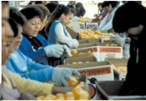
Planta moderna de empaque

La naranja autóctona de Brasil era más dulce y tenía más sabor, no tenía semillas y su piel gruesa y fácil de pelar la protegía durante los envíos. Hoy