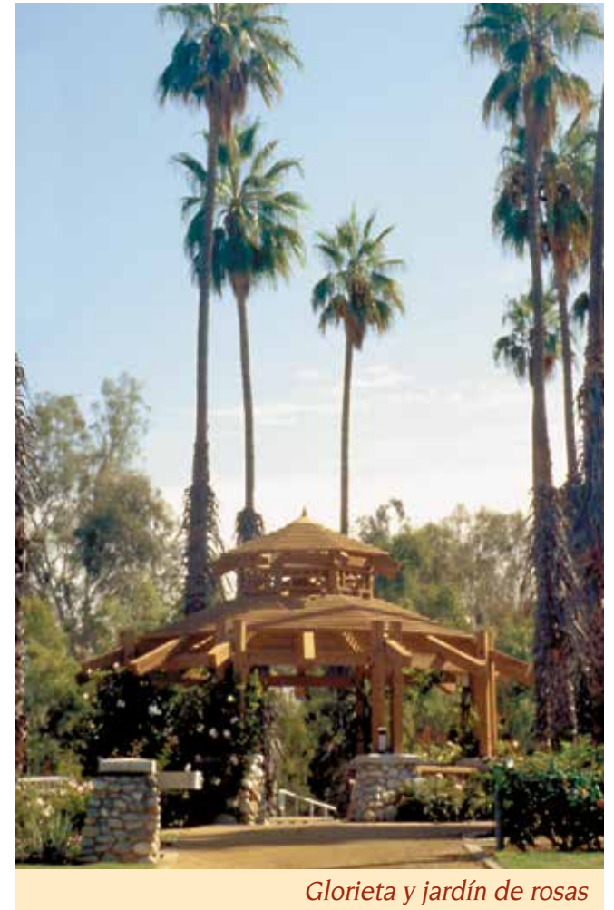
Glorieta y jardín de rosas

Este parque recibe apoyo en parte de una organización sin fines de lucro. Para obtener más información comuníquese con: