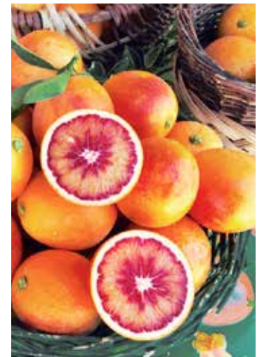
Naranjas sanguinas Moro

Desde entonces, los indígenas de California han estado recuperándose de su trauma histórico, honrando sus tradiciones culturales y contribuyendo como miembros vitales de la comunidad.