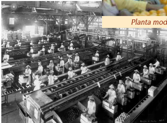
Planta de empaque, ca. 1900

casi todos los naranjos Washington Navel cultivados en California descienden de estos dos naranjos originales, uno de los cuales todavía crece en la intersección de las Avenidas Arlington y Magnolia de Riverside.