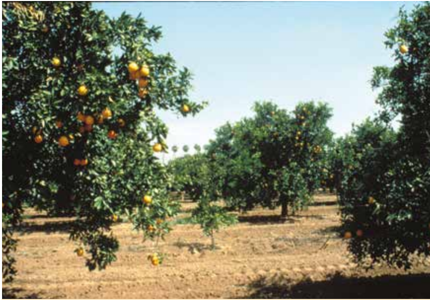
Restauración de un paisaje de cítricos

Cañón Mockingbird. El canal doblaba el área de producción de cítricos de Riverside y todavía suministra agua a las granjas locales de cítricos y los huertos del Parque Histórico Estatal Citrus de California.