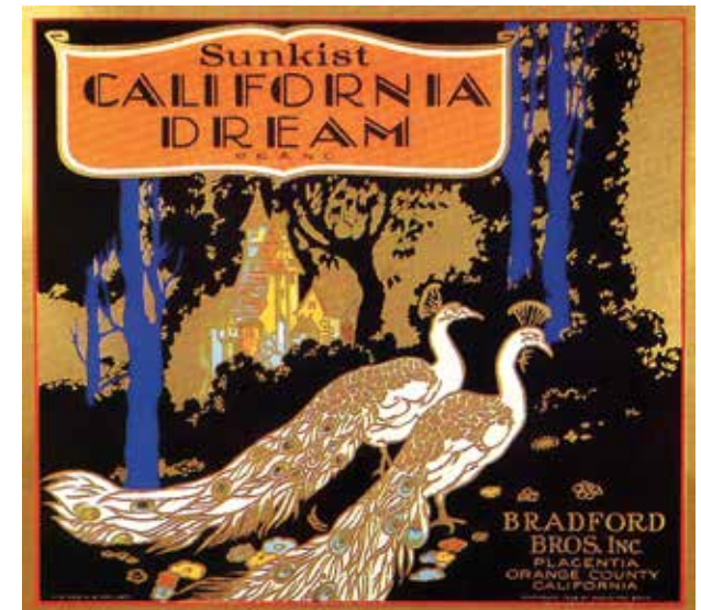
Etiqueta artística de una caja

Los planes futuros incluyen la recreación de componentes clave de la industria histórica de los cítricos y programas interpretativos ampliados.