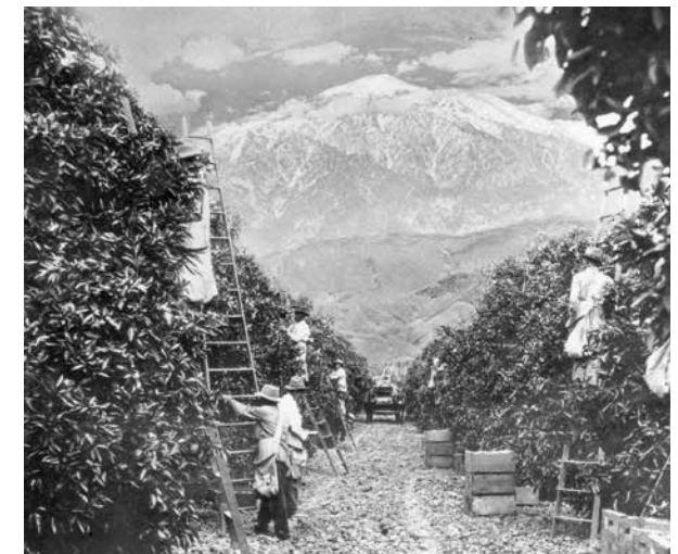
Cosecha de naranjas, ca. 1900