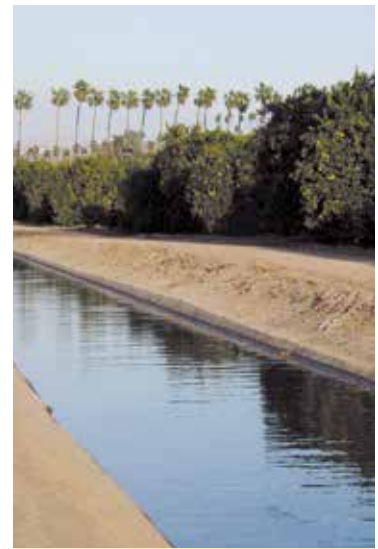
El Canal Gage

de la década de los cuarenta, los hispanicos componían aproximadamente dos tercios de la fuerza laboral de la industria de los cítricos. Las mujeres eran el pilar en las casas de empaquetado mientras que los hombres se ocupaban de los huertos.