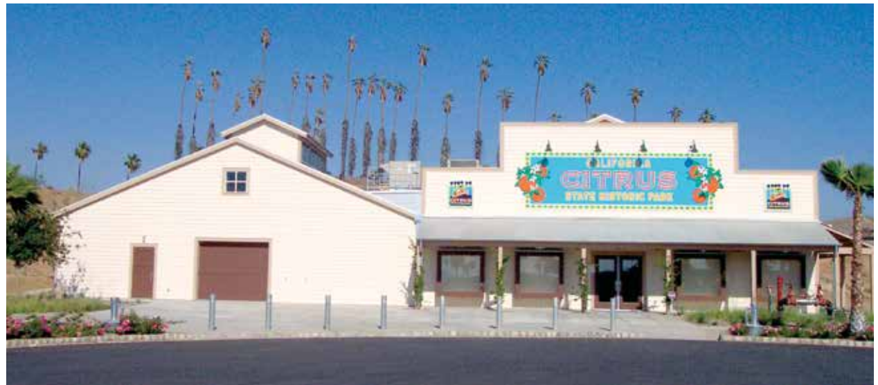
Centro de Visitantes

Las plantas nativas más comunes que crecen junto al lecho del Cañón Mockingbird son los sauces y los azumiates. Aquí también hay especies de plantas no nativas, como el eucalipto y la caña común. Las especies típicas de las partes altas del cañón incluyen la artemisia de California, varias especies de alforfón, bayas del saúco azul, la lechuga del minero, solanáceas y el Lycium.