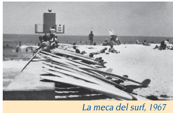
La meca del surf, 1967

La playa estatal Doheny lleva su nombre en honor al petrolero Edward L. Doheny. En 1893, pidió un préstamo de dinero para excavar el primer pozo petrolero de la ciudad en el cual encontró petróleo a 200 pies de profundidad. Doheny creó un vasto