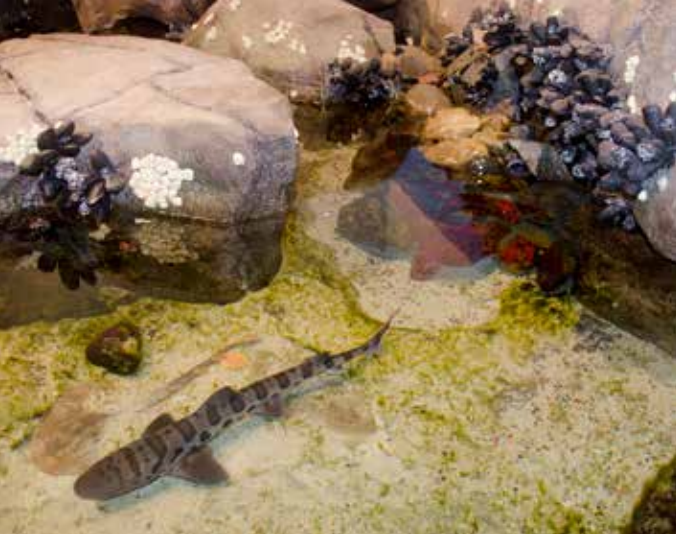
Los residentes de la piscina de mareas en el centro de visitantes

y el correlimos tridáctilo ( Calidris alba ) eligen la arena. Cuando es temporada, Doheny cuenta con las visitas migratorias de las ballenas grises que se encuentran mar adentro y también de las mariposas monarcas. La vida marina incluye el pez gruñón, el fletán y la raya, mientras que los garibaldi y los delfines comunes también nadan por debajo de las olas.