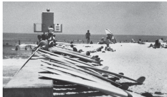
La meca del surf, 1967

La playa estatal Doheny lleva su nombre en honor al petrolero Edward L. Doheny. En 1893, pidió un préstamo de dinero para excavar el primer pozo petrolero de la ciudad en el cual encontró petróleo a 200 pies de profundidad. Doheny creó un vasto