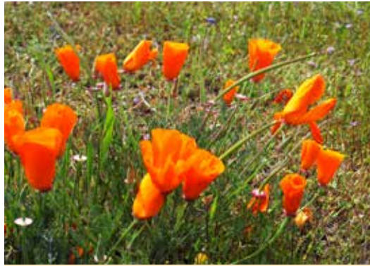
Las amapolas de California son algunas de las que se encuentran entre las flores silvestres del parque.

Con el comienzo de la Guerra Civil en 1861, los soldados dragones fueron enviados a proteger Los Ángeles, y luego fueron transferidos al este para luchar en la guerra. Durante el verano de 1862, se desató gran violencia entre los usurpadores colonos blancos y los paiutes del Valle Owens que querían proteger sus tierras. Tres compañías de caballería de voluntarios de California trasladaron a la fuerza a los paiutes a la Reserva Sebastian, sin embargo, las autoridades de ese lugar se negaron a asumir responsabilidad por ellos. En 1863, cientos de estos indios fueron trasladados a Fort Tejon, que luego fue usado por los voluntarios de California. Casi sin