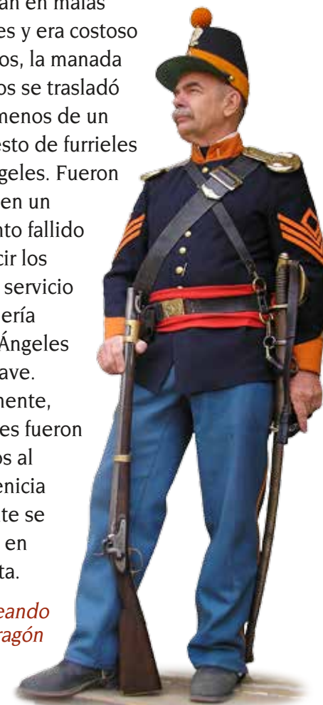
Un voluntario recreando a un soldado dragón

Debido a que los animales se encontraban en malas condiciones y era costoso alimentarlos, la manada de camellos se trasladó luego de menos de un año al puesto de furrieles de Los Ángeles. Fueron utilizados en un experimento fallido para reducir los costos del servicio de mensajería entre Los Ángeles y Fort Mojave. Posteriormente, los animales fueron trasladados al Arsenal Benicia y finalmente se vendieron en una subasta.