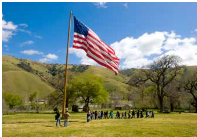
Participantes del programa historia viviente

En la década de 1850, el descubrimiento de oro atrajo miles de personas a California. Los enfrentamientos eran frecuentes entre