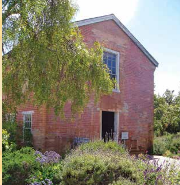
Primera Casa de Ladrillo