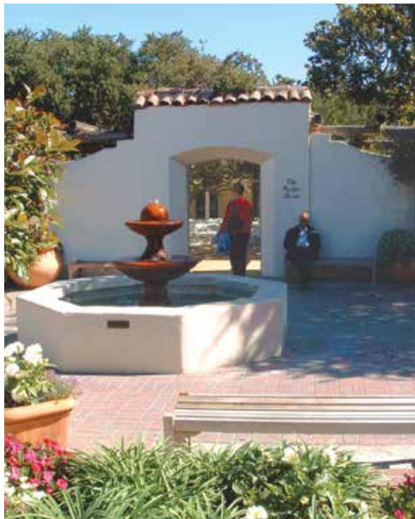
Los Jardines de Memoria y Sensoriales de The Pacific House

Monterey ha seguido atrayendo a aquellos que buscan un retiro pastoral. En el transcurso de los años, la hermosa costa de Monterey ha inspirado a muchos artistas y escritores como el escritor escocés Robert