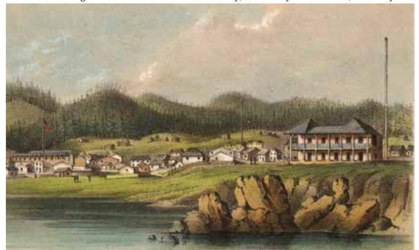
Vista de tierra adentro de Monterey, por Bayard Taylor, ca. 1850