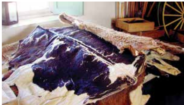
Cueros mostrados en la Custom House

Habitada por los Indios Rumsien durante miles de años, la variada vida animal y vegetal de la Península de Monterey cubrió todas sus necesidades. La población Rumsien movía sus aldeas según las estaciones por todo su territorio para pescar, cazar y recolectar plantas. Expertos artesanos elaboraban cestas tejidas finamente, a menudo decoradas con colgantes de conchas de mar, plumas de codorniz y plumas de pájaro carpintero. La llegada de los europeos a California cambió radicalmente