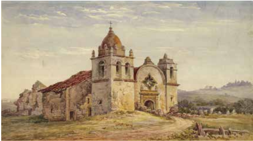
Misión de San Carlos Borromeo, por Edwin Deakin, ca. 1900

las restricciones comerciales. Los puertos costeros se abrieron al comercio exterior, atrayendo a los comerciantes británicos, norteamericanos y sudamericanos. Para cobrar los derechos de aduana—una de las principales fuentes de ingresos de Alta California—del floreciente comercio marítimo exterior, el gobierno mexicano construyó la Custom House, el edificio gubernamental más antiguo en California y el primer Monumento Histórico del estado de California.