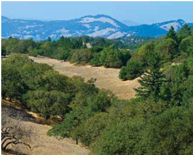
Cadena montañosa Mayacamas en la distancia

mayo en la intersección del sendero Marsh Trail. El sendero Canyon termina en el lago luego de pasar por Hunter Spring, donde se ubica un abrevadero para los caballos.