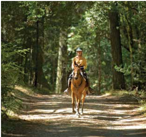
Sendero Warren Richardson

El terreno de Annadel cuenta con una gran diversidad de comunidades de plantas, incluidos prados, praderas, bosques y chaparrales. Las condiciones ambientales favorecen el desarrollo de varios hábitats, lo cual hace posible que se pueda observar una gran variedad de aves y animales durante las visitas. Generalmente se pueden ver ciervos al atardecer, y los coyotes se encuentran entre las variadas especies de la vida silvestre del lugar.