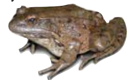
Rana de patas rojas de California

Canyon Trail (ruta de servicio) —Este sendero de 2 millas comienza en la intersección del sendero Spring Creek, cerca del puente de madera. La inclinación del sendero aumenta de manera constante. En la cima, descubra una vista panorámica de Santa Rosa, la cadena montañosa Mayacamás con los géiseres y el Monte Santa Helena. Coloridas Pedicularis densifloras ("Indios guerreros") eclosionan desde marzo a