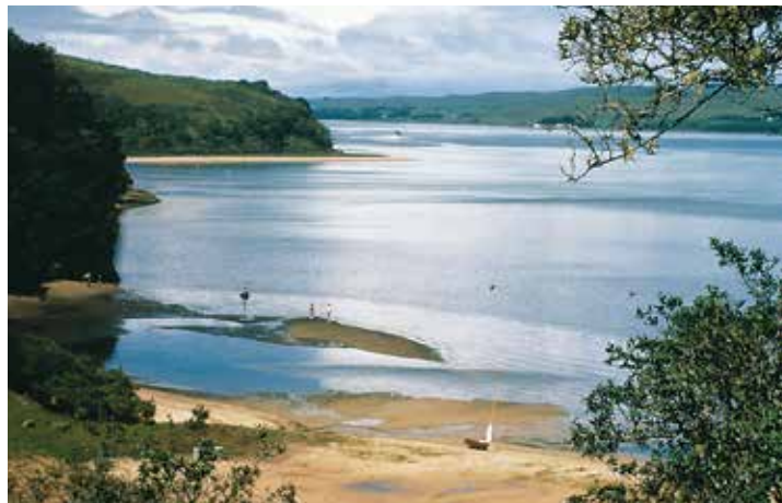
Mirador de Vista Point

En 1579, sir Francis Drake tomó toda el área para Inglaterra y la llamó Nova Albion (Nueva Inglaterra). Casi 25 años después, el explorador español don Sebastian Vizcaíno nombró el área que hoy es conocida como Punta Reyes “La Punta de los Tres Reyes”, luego del día del Festival de los Tres Reyes. “Tomales” se cree que es una entonación en español de la palabra de costa Miwok para “bahía”. La mayor parte del área de la bahía de Tomales permaneció virgen hasta