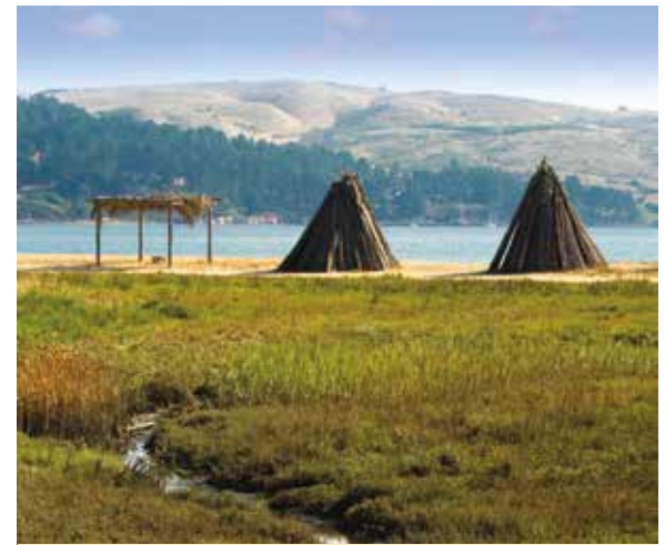
Kotchas de costa Miwok en la playa Indian

Las playas Heart's Desire, Vista Point y Millerton Point tienen habitaciones accesibles. Hay mesas de pícnic accesibles en la playa Heart's Desire.