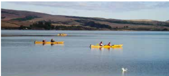
Las playas pacíficas, protegidas de la brisa, hacen que este sea un área popular de recreación acuática.

Aquí prospera la fauna. El área está habitada por zorros, mapaches, tejones, comadreas, linceos, zorrillos, rata montera, topos y otros animales. Numerosas especies de aves terrestres y acuáticas, incluidas las lechuzas que se ven poco, atraen a los ornitólogos y observadores de aves. Hay muchas variedades de almejas, moluscos, cangrejos y otros animales marinos pequeños que viven cerca de las playas, y la bahía aloja tiburones, mantarrayas y muchos otros tipos de peces.